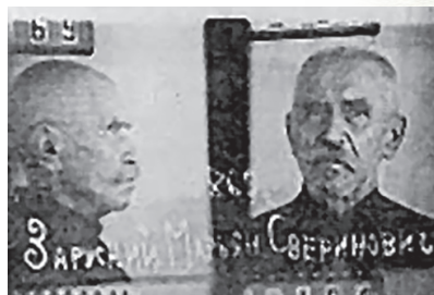
Mariusz Zaruski po aresztowaniu przez NKWD

Po intensywnym śledztwie został uznany za „element społecznie niebezpieczny” i skazany na 5 lat łagru w Kraju Krasnojarskim. Nie zdążył jednak tam dotrzeć, gdyż wiosną 1941 r. zapadł na krwawą dyzenterię i w ciężkim stanie trafił do szpitala więziennego. Wycieńczony organizm nie sprostał chorobie. Mariusz Zaruski zmarł 8 kwietnia 1941 r., został pochowany na więziennym cmentarzu.