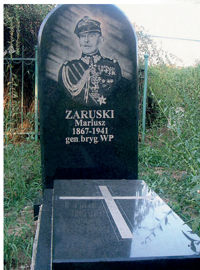
Symboliczny grób gen. Zaruskiego na terenie byłego więzienia w Chersoniu

Trup męski prawidłowej budowy ciała rażąco wyniszczony złym odżywianiem (głodem).