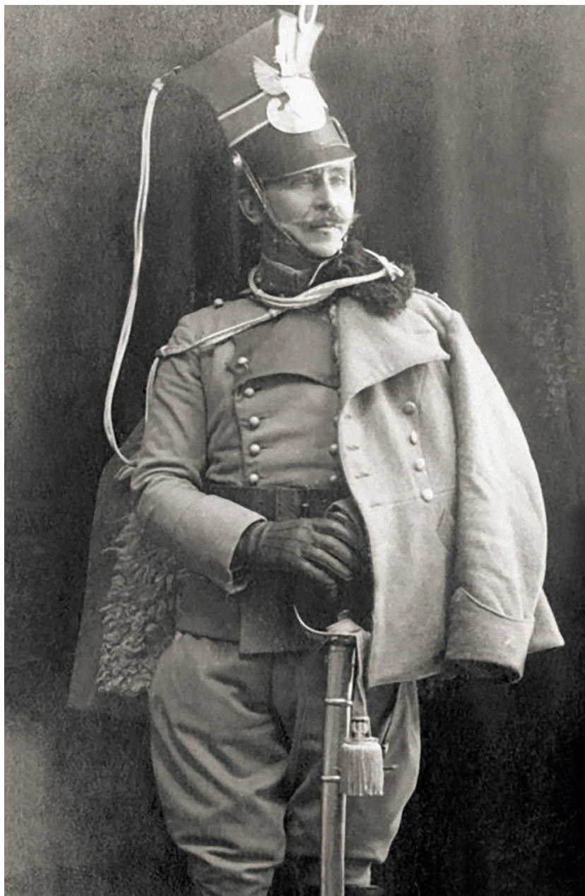
Mariusz Zaruski jako oficer kawalerii Legionów Polskich, ok. 1917 r.