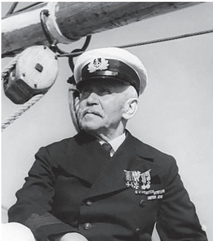
Na pokładzie szkunera „Zawisza Czarny”

im ojciec – uczestnik powstania styczniowego – oraz dziad – weteran powstania listopadowego. Z ich wieczornych gawęd i pieśni wyląniał się przed malcami obraz Polski dumnej i niepodległej.