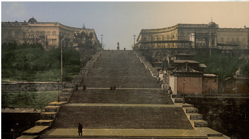
Schody Potiomkinowskie w Odessie, ok. 1900 r.

tem Cesarstwa Rosyjskiego. Zaruskiemu, który od małego zaczytywał się w Robinsonie Cruzoe i książkach Juliusza Verne'a, kosmopolityczna Odessa wydawała się oknem na świat. Musiało to być frapujące dla człowieka, który poza stepowym krajobrazem Podola nic dotychczas nie widział. Zaruski starał się utrwać na płótnie podpatrzone sceny z życia portowego i piękno fal morskich. Ośmielony udanymi próbami marynistycznymi, wstąpił do odeskiej Szkoły Sztuk Pięknych. By móc zaś wreszcie zrealizować marzenie z dzieciństwa, w czasie studenckich wakacji zaciągał się do pracy na statkach handlowych. Jako majtek okrętowy odbył szereg egzotycznych podróży: na wschód i ten bliższy (Syria, Egipt), i ten dalszy (Indie, Chiny, Japonia).