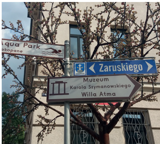
Ulica Zaruskiego (róg Krupówek) w sercu Zakopanego

Mariusz Zaruski, Wśród wichrów i fal (1935)