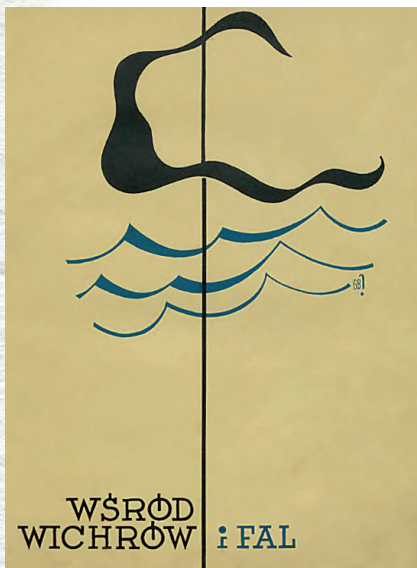
Okładka pierwszego wydania, 1935 r.

Z ostatniego rejsu – do szwedzkiej Karlskrony – powrócił do Gdyni 20 sierpnia 1939 r. Do kolejnego rejsu „Zawiszy” zapowiadanego na koniec wakacji już nie doszło.