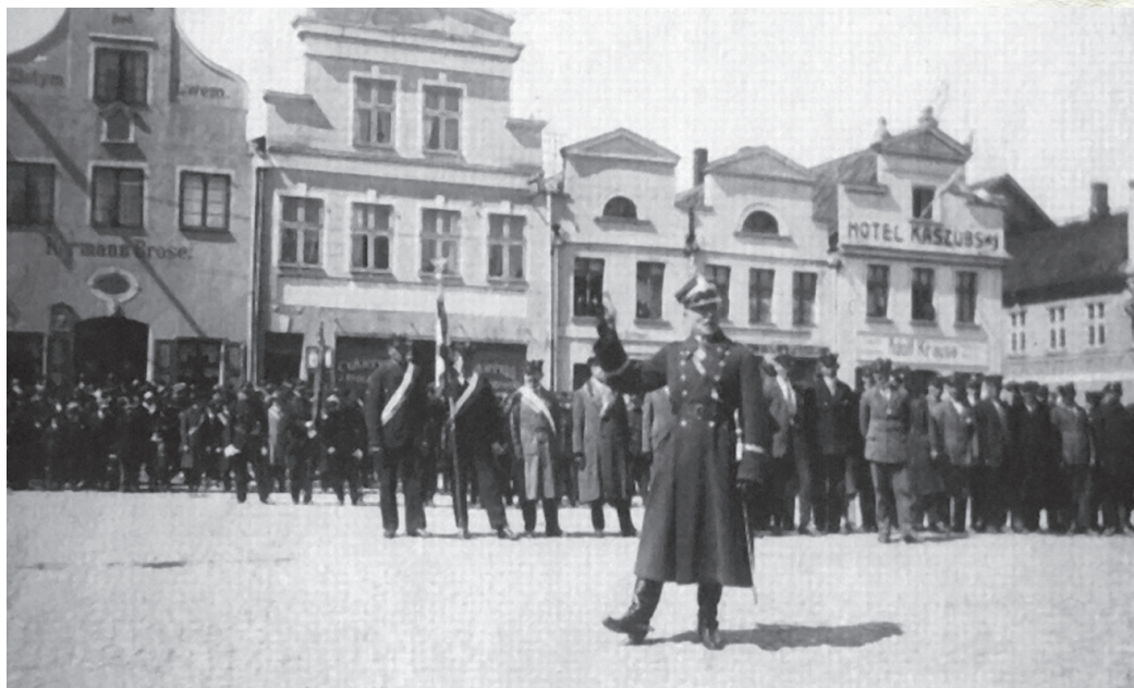
Starosta morski Mariusz Zaruski przemawia na rynku w Pucku, 3 maja 1927 r.

larności – wybrany na prezesa Polskiego Związku Żeglarskiego. Za jego prezesury doprowadzono do integracji żeglarstwa harcerskiego, akademickiego i klubowego. Szczególny nacisk kładł Zaruski na rozwój żeglarstwa morskiego.