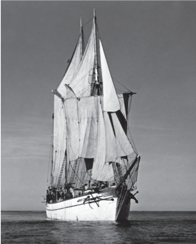
„Zawisza Czarna”, 1937 r.