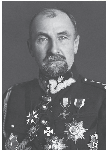
Generał Tadeusz Rozwadowski, połowa lat dwudziestych XX w.

Tworzenie polskiej administracji na zajętej części Spisza zostało usankcjonowane porozumieniem o rozgraniczeniu terenów, zawartym 24 grudnia 1918 r. w Popradzie przez polskich i czeskosłowackich działaczy lokalnych. Za zasługi w walce o polskość tej ziemi Zaruski otrzymał z rąk gen. Edwarda Rydza-Śmigłego awans na majora.