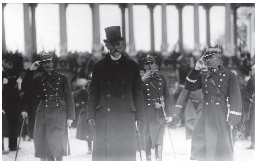
Mariusz Zaruski (z prawej) w roli adiutanta prezydenta RP Stanisława Wojciechowskiego (w środku), 1925 r.

W połowie sierpnia 1919 r. beliniacy zostali przerzuceni na białoruski odcinek frontu. We wrześniu pułk po ciężkich walkach zajął i utrzymał pozycje po zachodniej stronie rzeki Dźwiny. Po miesiącu