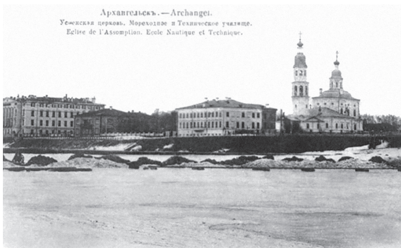
Nabrzeże Dwiny w Archangielsku, 1912 r.

W lipcu tego roku Zaruski uzyskał zgodę na przeniesienie do Archangielska w związku z planami kształcenia umiejętności żeglarskich na tamtejszych kursach szyperskich. Po zameldowaniu się we właściwym urzędzie policji podjął pracę w porcie przy rozładunku łodzi, kutrów i statków. Mieszkał w wynajętym pokoiku na poddaszu domu, w którym kwaterował inny Polak, Tadeusz Gałęcki. Ten działacz niepodległościowy za przynależność do Polskiej Partii Socjalistycznej trafił zrazu do X Pawilonu Cytadeli Warszawskiej, a następnie znalazł się na zesłaniu w Archangielsku. Młodzi konspiratorzy szybko znaleźli wspólny język. Gałęcki, który wiele lat później, już jako Andrzej Strug, będzie znanym pisarzem i publicystą, na dalekiej północy stawiał