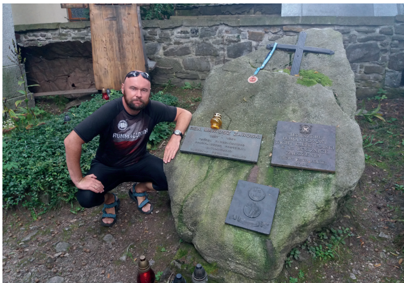
Autor przy grobie Mariusza Zaruskiego na zakopiańskim cmentarzu

Imię Mariusza Zaruskiego nosi basen żeglarski w gdyńskim porcie, a nieopodal miejsca, skąd „Zawisza Czarny” wyruszał w rejsy, stoi popiersie generała. W 2014 r. przy wejściu na molo w Pucku została odsłonięta Ławeczka Mariusza Zaruskiego. Wiele szkół i drużyn harcerskich w całej Polsce nosi jego imię, ponadto w kilku miastach (w Gdyni, Katowicach, Warszawie, Zakopanem) Zaruski został patronem ulicy. W Sosnowcu działa oddział Polskiego Towarzystwa Tatrzańskiego im. gen. Mariusza Zaruskiego.