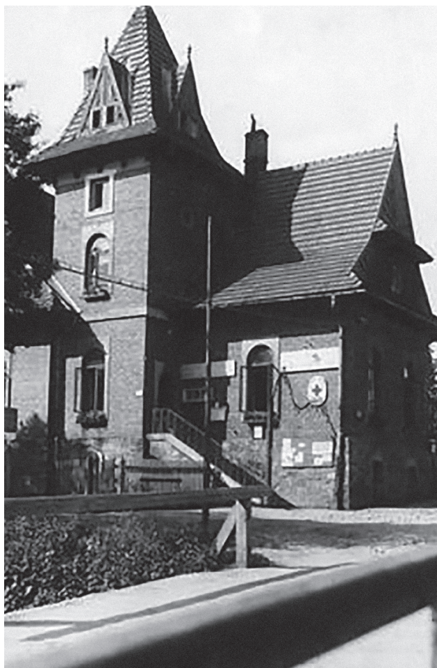
Siedziba TOPR w Dworcu Tatrzańskim, okres międzywojenny

pówek przytulny „Krywań” stawał się jednym z ośrodków kulturalnych, do którego bardziej lub mniej regularnie zjeżdżały takie osobistości jak Ignacy Daszyński – lider Polskiej Partii Socjalno-Demokratycznej Galicji i Śląska Cieszyńskiego oraz poseł do parlamentu wiedeńskiego – czy autor Chłopów i przyszły noblista Władysław Stanisław Reymont. W „Krywaniu” bywali również obaj Piłsudscy – Bronisław, uczonek i działacz społeczny, oraz jego młodszy brat Józef, konspirator i działacz niepodległościowy. Do towarzyszy dysput i tatrzańskich