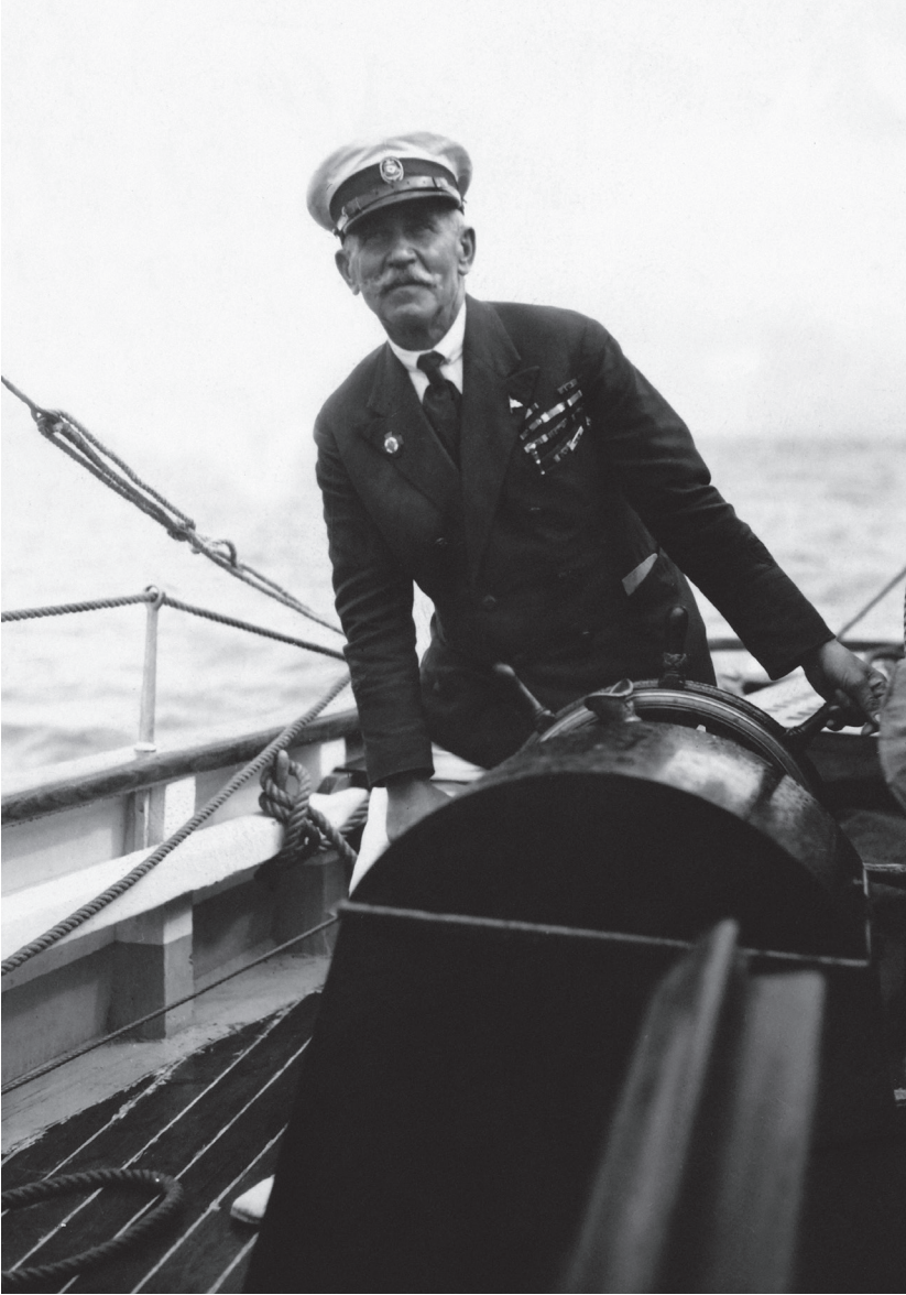
Kapitan „Zawiszy Czarnego” za sterem, druga połowa lat trzydziestych XX w., (fot. NAC)