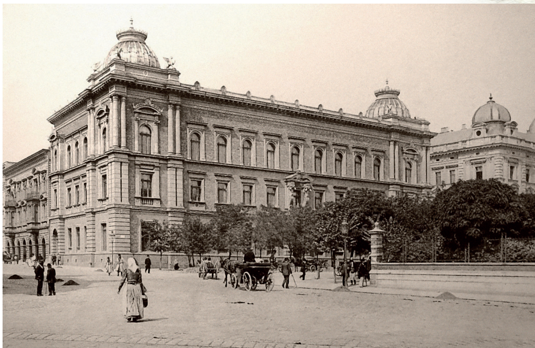
Gmach Akademii Sztuk Pięknych w Krakowie, początek XX w.

działać w Uniwersytecie Ludowym im. Adama Mickiewicza, wszedł również do zarządu Towarzystwa Szkoły Ludowej, organizacji znajdującej się pod wpływem Ligi Polskiej. Jako orędownik szerzenia oświaty wśród ludu zbliżył się poglądami do znanego galicyjskiego socjalisty Ignacego Daszyńskiego.