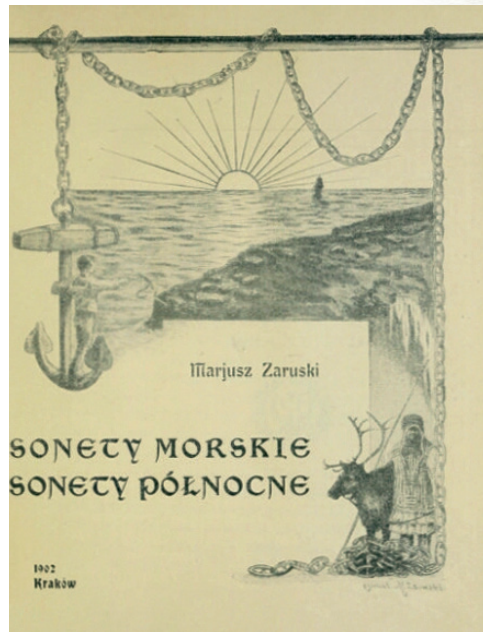
Strona tytułowa Sonetów morskich, 1902 r.