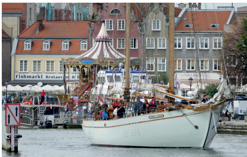
STS „Generał Zaruski” podczas zlotu oldtimerów w Gdańsku, 7 września 2019 r.

W 1971 r. na Starym Cmentarzu na Pęksowym Brzyzku w Zakopanem odsłonięto symboliczny nagrobek gen. Zaruskiego. 11 listopada 1997 r. na cmentarzu złożono urnę z ziemią pobraną z dziesięciu miejsc na cmentarzu w Chersoniu (dokładne miejsce pochówku generała pozostaje nieznane). W tym samym roku odznaczono Zaruskiego pośmiertnie Krzyżem Wielkim Orderu Odrodzenia Polski.