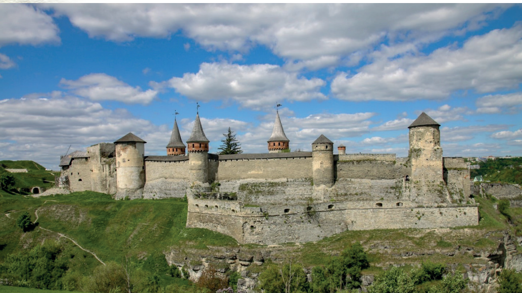
Twierdza w Kamieńcu Podolskim, widok współczesny

Podolskim, gdzie trafił pod opiekę swego stryja Józefa, weterana powstania styczniowego i działacza niepodległościowego. Pod jego okiem gimnazjalista przeistaczał się powoli w konspiratora i niepodległościowca. Nawiązał też kontakt z rewolucjonistami rosyjskimi.