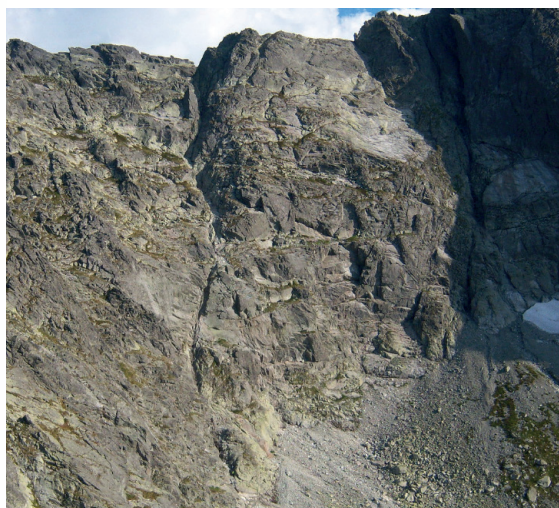
Rysa Zaruskiego w grani Orlej Perci ponad Kozią Dolinką