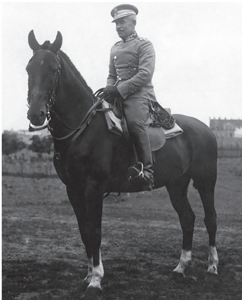
Mariusz Zaruski, 1920 r.

Niestety już 13 stycznia 1919 r. wojska polskie musiały się wycofać ze Spisza i Orawy. Był to skutek zarówno nacisków ententy, jak i akcji militarnej Czechów, którzy łamiąc ustalenia lokalnych ośrodków władzy obu odradzających się państw, wkroczyli na Śląsk Cieszyński. Konflikt zakończył się w lipcu 1920 r., kiedy mocarstwa sprzymierzone podjęły